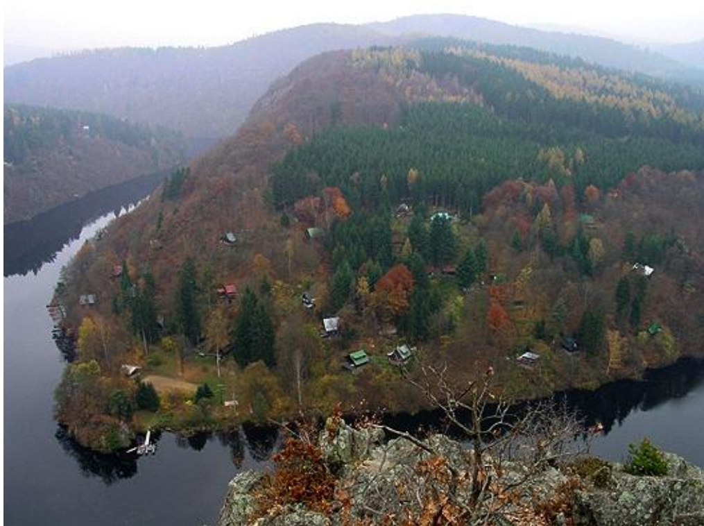
Dnešní pohled na Ztracenku z vyhlídky.