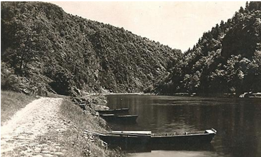
Pohled proti proudu Vltavy na kopec Kletecko.