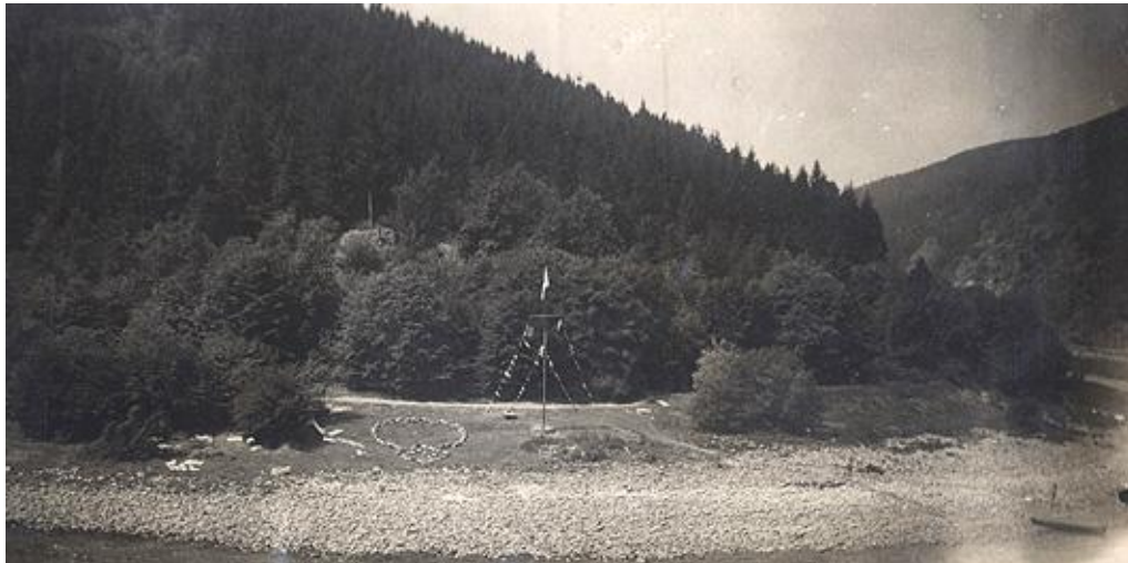
Pohled od úpatí Kletecka na původní Ztracenu.