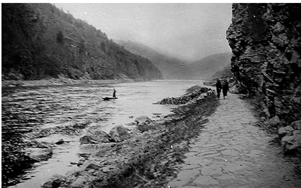
Potahová stezka pod kopcem Kletecko ve starých Svatojánských proudech.