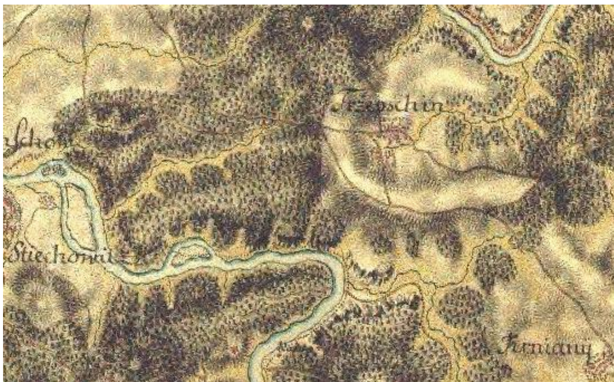
I. vojenské mapování – josefské, 1764 -1768 a 1780 -1783