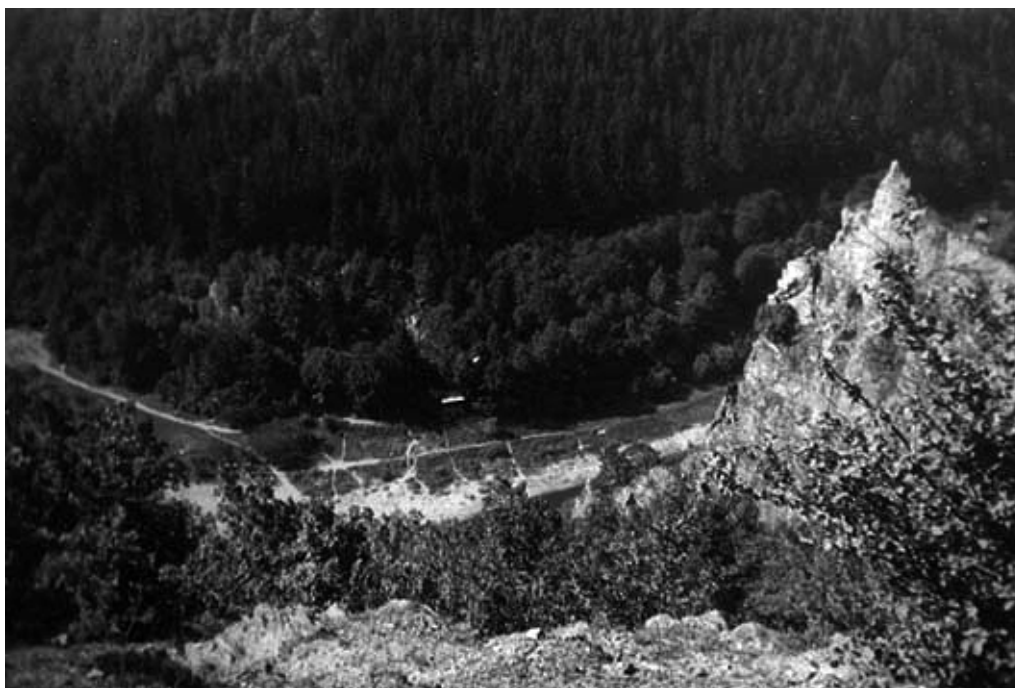
Pohled z Kletecka na původní osadu Ztracená naděje