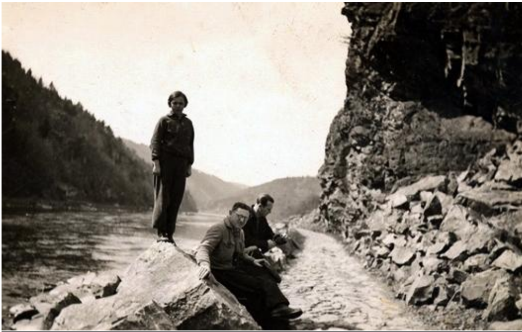
Turisti na potahové stezce pod kopcem Kletecko