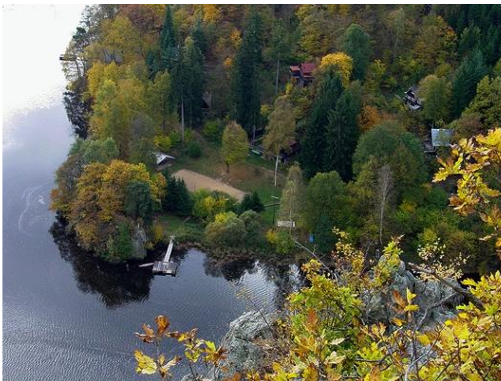
Detailnější pohled na Ztracenu, osadní hřiště a přístaviště.