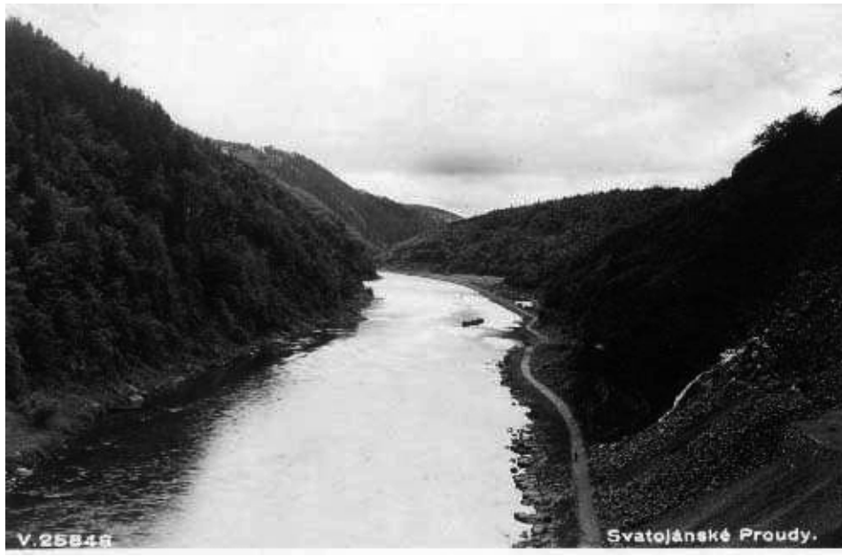
Horní buk r. 1931. Řeka už v těchto místech netvořila peřeje, ale volně protékala údolím pod vrchem Kletecko